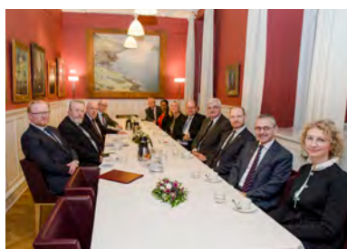
Fra et møde. Altingets Præsidium sammen med Urban Ahlin, Riksdagens formand, og repræsentanter fra Riksdagen, i Altinget i februar 2018.

De internationale udvalgs medlemmer vælges på Altingets første møde efter et altingsvalg. Der vælges 3–7 medlemmer og lige så mange suppleanter. Virksomheden i Altingets internationale udvalg varierer afhængigt af status og arbejdsgrundlag for de internationale parlamentariske organisationer Altinget er medlem af. Nogle internationale parlamentariske organisationer fungerer ved siden af et ministerråd som er forum for samarbejde mellem regeringer. Hvor det er tilfældet, har de parlamentariske organisationer formel stilling, forpligtelser og rettigheder over for ministerrådet og retter forslag og resolutioner til det. Andre parlamentariske organisationer har uformelt samarbejde med myndigheder eller internationale organisationer. Altingets internationale udvalg deltager i møder og konferencer i internationale parlamentariske organisationer som Altingets repræsentanter. De benytter lejligheden til at fremføre Islands synspunkter når der er grund til det. Internationale parlamentariske organisationer udarbejder rapporter og vedtager resolutioner og forslag der rettes til medlemslandenes myndigheder og til internationale organisationer. De parlamentariske organisationer er desuden et forum hvor parlamentarikere kan udveksle meninger og information. Altingets internationale udvalg arrangerer desuden møder og konferencer for de parlamentariske organisationer i Island.