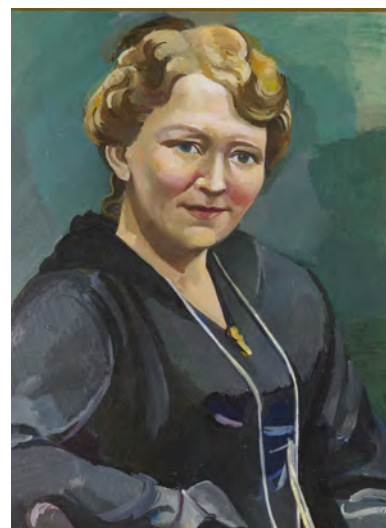
Den første kvinde der blev medlem af Altinget, var Ingibjörg H. Bjarnason (1867–1941). Hun var medlem 1922–1930.

Med forbundsloven der trådte i kraft den 1. december 1918, blev Island anerkendt som en suveræn stat i personalunion med Danmark. Kongen skulle underskrive love fra Altinget for at de kunne træde i kraft, og havde ret til at nægte det ifølge forfatnin-