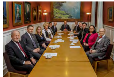
Altingets formand og næstformænd mødes regelmæssigt for at organisere det parlamentariske arbejde i Altinget.

Der høres ofte bemærkninger om at der ikke er ret mange medlemmer til stede ved forhandlingerne i Altinget. Der kan være forskellige årsager til det. Medlemmerne i hver partigruppe fordeler til dels opgaverne mellem sig og specialiserer sig i visse sagsområder. Transmissioner fra møder i Tinget gør folk i stand til at følge med i forhandlingerne andre steder end i Altingssalen. Et altingsmedlems arbejde kræver desuden at han imødekommer ønsker om at drøfte forhold med folk der ønsker det, og det gælder både private samtaler og offentlige møder. En væsentlig del af medlemmernes tid går også med at forberede sager og skrive redegørelser og udvalgsbetænkninger.