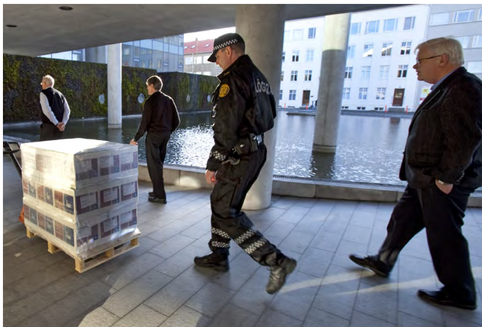
Politiet sørger for transporten af stemmesedlerne fra trykkeriet til valgstederne.

Ved altingsvalgene indhenter de politiske partier mandat fra folket til at tage ansvaret for både den lovgivende og den udøvende magt. Der er stærk tradition for at danne flertalsregeringer, men oppositionen i Tinget holder regeringen i tømme. Der afholdes normalt altingsvalg hvert fjerde år. Islands præsident kan imidlertid opløse Tinget inden udløbet af den normale valgperiode og udskrive nyt valg. Alle islandske statsborgere der på valgdagen er ældre end 18 år og har eller har haft fast bopæl i Island, har stemmeret ved altingsvalg. Enhver der har valget og hvis rygte er uplettet, kan opstille til et altingsvalg. For opstillingen er der en række betingelser, fx at et tilstrækkeligt antal borgere skriftligt har erklæret at de støtter opstillingslisten. Efter valget har 63 kandidater fået mandat til at være medlemmer af Altinget.