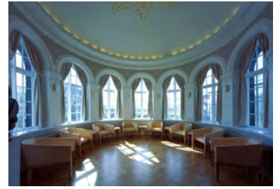
Kringlan er en tilbygning til Altingsbygningen fra 1908.