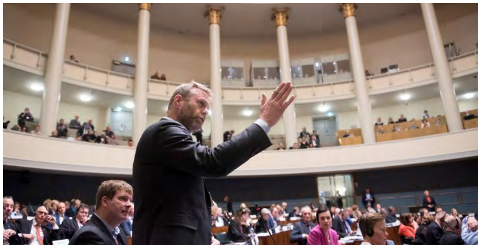
Fra et møde i Nordisk Råd i Helsinki 2017.