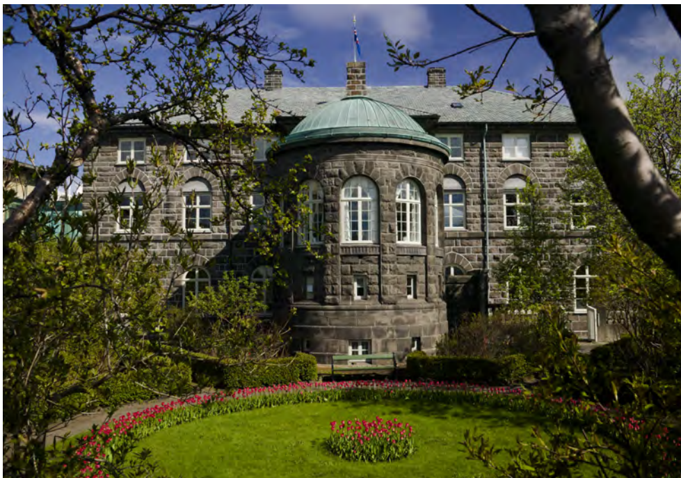
Altingets have og sydsiden af Altingsbygningen.