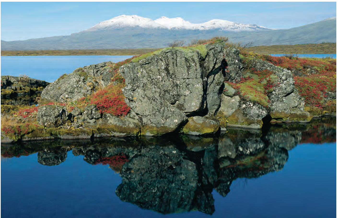
Der er ikke mange steder i Island hvor historie og natur flettes sammen i samme grad som på Þingvellir. Der har man et enestående overblik over den geologiske historie, og områdets levende natur har næppe noget sidestykke. På Þingvellir stiftedes Fristaten Island med stiftelsen af Altinget i 930, og der trådte Tinget sammen lige til 1798.

Forfatningens bestemmelser om meningsfrihed, yringsfrihed, foreningsfrihed og mødefrihed er også klare kendetegn ved det demokratiske system. I virkeligheden er disse elementer en nødvendig forudsætning for demokratiet, så landets borgere er sikret ret til deltagelse i samfundets forhold. Beslutninger der træffes i Altinget, har indflydelse på alle islændinges daglige liv. Formålet med udgivelsen af en brochure om Altinget er at oplyse om Tingets organisation og arbejde samt dets historie. Den skulle derfor være til nytte for alle der er interesseret i at få noget at vide om Altinget.