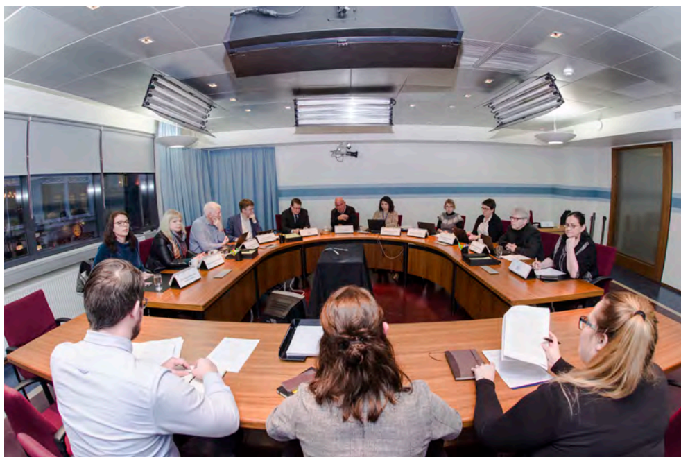
I Altinget er der otte stående udvalg. Møde i Alment og Uddannelses- og Kulturudvalg.