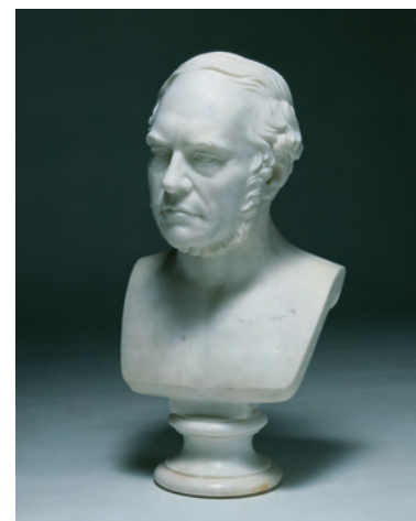
Jón Sigurðsson (1811–1879) var det islandske folks leder i den første periode af selvstændighedskampen. Hans virke bar frugt med den første forfatningslov i 1874. Til ære for ham blev hans fødselsdag, den 17. juni, valgt som stiftelsesdag for republikken i 1944, og siden har den været Islands nationaldag.

Ved slutningen af 1300-tallet førte stiftelsen af Kalmarunionen til at kongemagten over Norge og dermed over Island overgik til Danmark. Kongens centrale magt voksede med reformationen i 1550, og i 1600-tallet indførtes enevælden i Danmark. I Island indførtes enevælden i 1662. Med enevælden ophørte forskellige gamle rettigheder for landsdele, og der skulle nu gælde den samme lov og de samme pligter for alle, men trods dette havde Island visse særlige rettigheder i det danske rige.