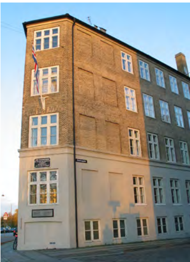
Islands kulturhus, Jónshús, ved Øster Voldgade 12 i København.

Udstillingen om Jón Sigurðsson er åben tirsdag, onsdag, torsdag og fredag kl. 11-17, lørdag og søndag kl. 10-16 og på andre tidspunkter i samråd med Jónshús forstander.