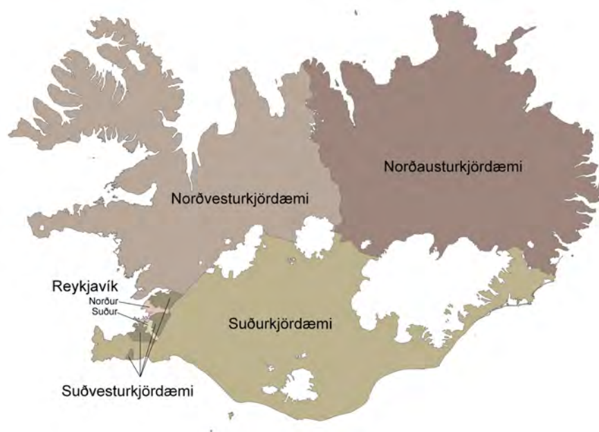
Island er opdelt i seks valgkredse, tre i hovedstadsområdet og tre uden for hovedstaden. Antallet af mandater i hver valgkreds afhænger af indbyggertallet.

Ved altingsvalgene indhenter de politiske partier mandat fra folket til at tage ansvaret for både den lovgivende og den udøvende magt. Der er stærk tradition for at danne flertalsregeringer, men oppositionen i Tinget holder regeringen i tømme. Der afholdes normalt altingsvalg hvert fjerde år. Islands præsident kan imidlertid opløse Tinget inden udløbet af den normale valgperiode og udskrive nyt valg. Alle islandske statsborgere der på valgdagen er ældre end 18 år og har eller har haft fast bopæl i Island, har stemmeret ved altingsvalg. Enhver der har valget og hvis rygte er uplettet, kan opstille til et altingsvalg. For opstillingen er der en række betingelser, fx at et tilstrækkeligt antal borgere skriftligt har erklæret at de støtter opstillingslisten. Efter valget har 63 kandidater fået mandat til at være medlemmer af Altinget.