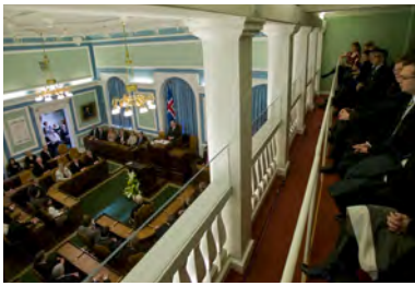
Der er offentlig adgang til tilhørerlogen når der er møde i Tinget, og fra den kan man følge med i Tingets forhandlinger.

Grundlaget for republikken Islands forfatning er at magtens kilde er hos folket der Goverdrager forvaltningen af denne magt til valgte repræsentanter. En sådan ordning kaldes et repræsentativt demokrati. Vælgerne vælger hvert fjerde år ved et alment, hemmeligt valg 63 medlemmer til Altinget. De administrerer i fællesskab magten til at indføre love for landets indbyggere, og desuden har de magten over landets finanser, magt til at fastsætte statens udgifter og de skatter der pålægges landets indbyggere. Det er vigtigt at folk ved hvilke beslutninger der tages på Altinget og hvordan de tages, for vælgerne og deres repræsentanter har ansvaret for at bevare et levende demokrati. Valgretten er så at sige fundamentet for demokratiet i Island, og Altinget er hjørneste- nen i det demokrati.