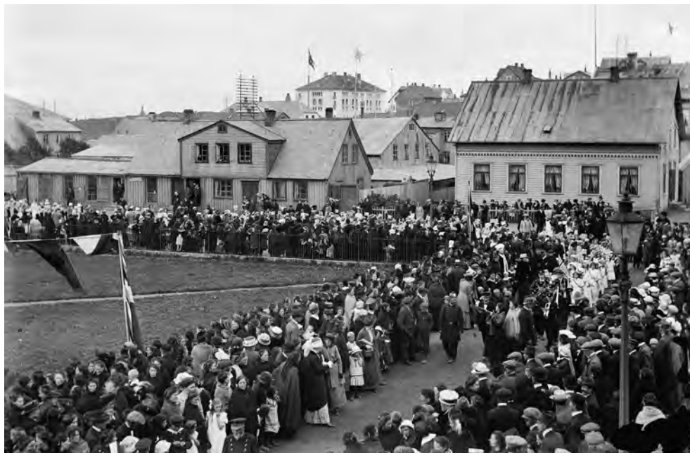
Kvinder fejrer deres valgret på Austurvöllur ved Tingets åbning den 7. juli 1915, men der blev først valgt en kvinde ind til Tinget i 1922. Ved altingsvalget i 2017 var 24 af de valgte mandater kvinder, svarende til 38%.