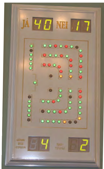
Medlemmerne afgiver stemme ved at trykke på en af tre knapper på deres bord. Resultaterne, og hvorledes hver enkelt har stemt, ses på lystavler i Tingsalen.